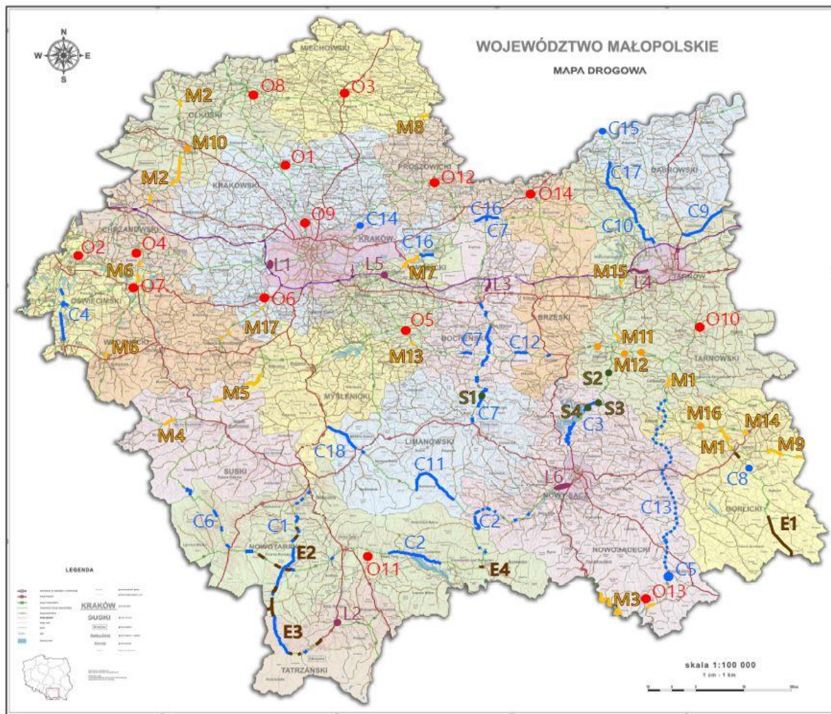
Rys.2. Planowane inwestycje drogowe w Małopolsce do roku 2023.