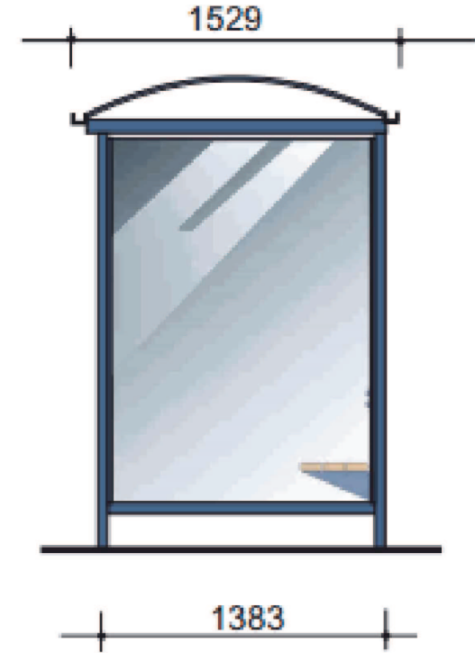
WIATA SYSTEMOWA KOLOR GRAFIT